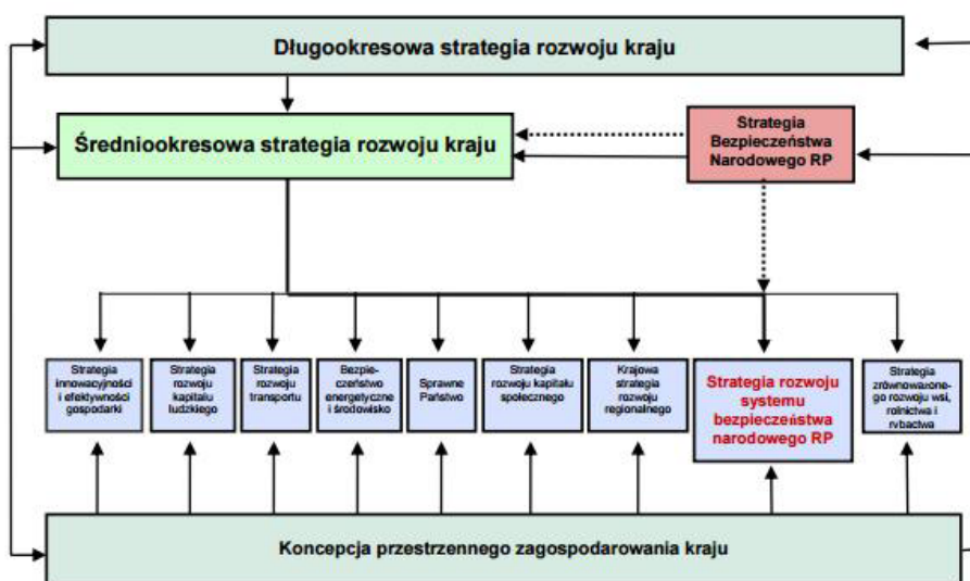
Rysunek 1. Hierarchia strategii wg MON

W przyjętej przez Radę Ministrów uchwale z dnia 9 kwietnia 2013 r. 9 znajduje się opracowanie własne MON określające hierarchię planów strategicznych (nie mające żadnej mocy, jednak wskazujące na systemowe podejście pracowników resortu bezpieczeństwa). Przedstawione jest ono na pierwszej ilustracji (zob. rys. 1).