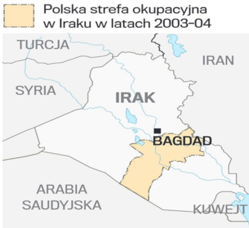
MAPKA 1. POLSKA STREFA OKUPACYJNA W IRAKU W LATACH 2003–2004