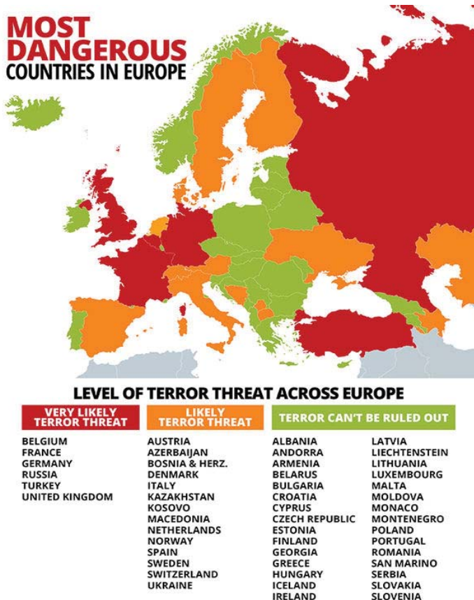
RYC. 1. POZIOM ZAGROŻENIA TERRORYZMEM W KRAJACH EUROPEJSKICH (STAN NA 2018 ROK)